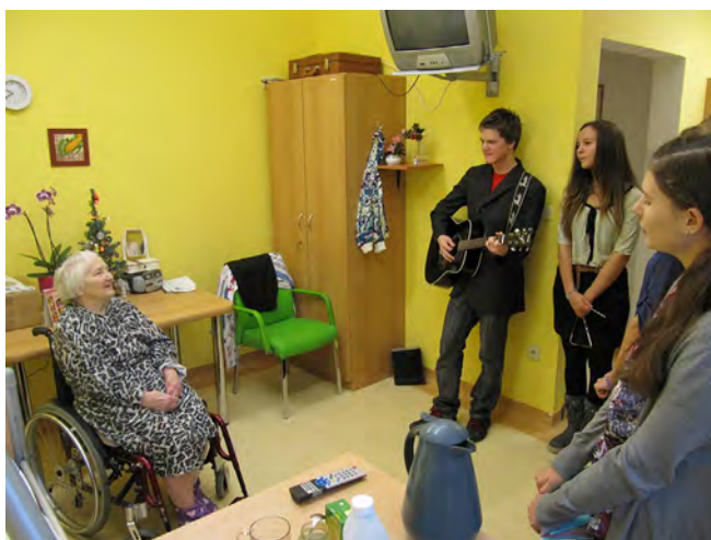
Vánoce na oddělení LDN olomoucké nemocnice.