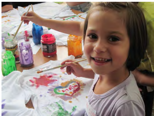
Dětský den s Jikou 19. 6. 2012