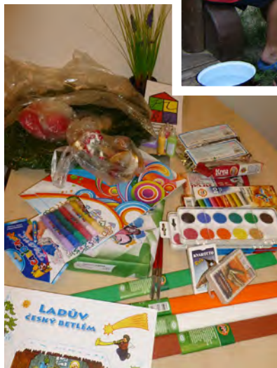
Nákup materiálu pro dobrovolníky z dotace