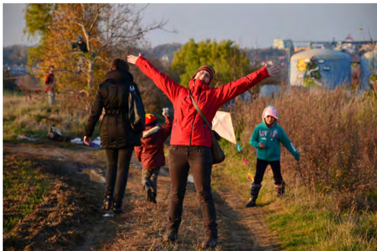
...není to fuk? Užili jsme si to :)